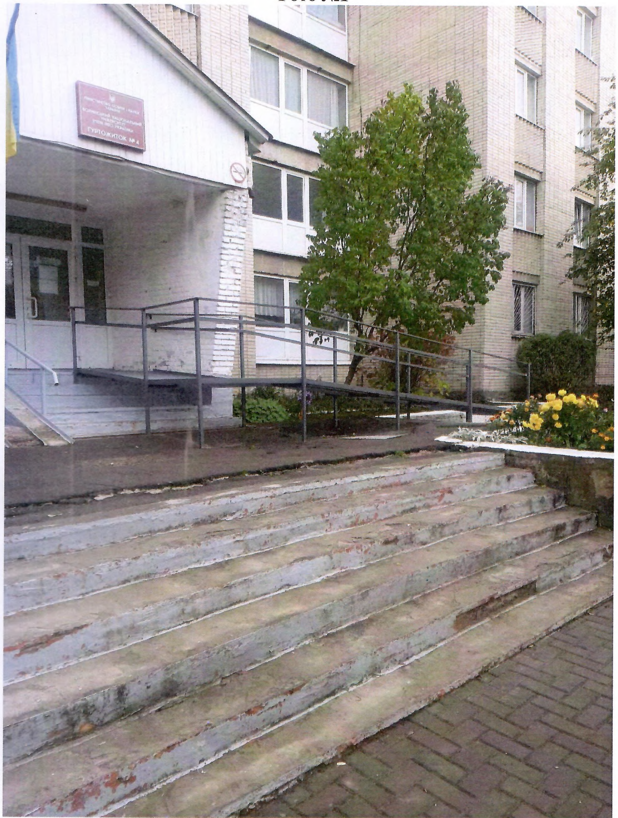
Загальний вигляд пандуса