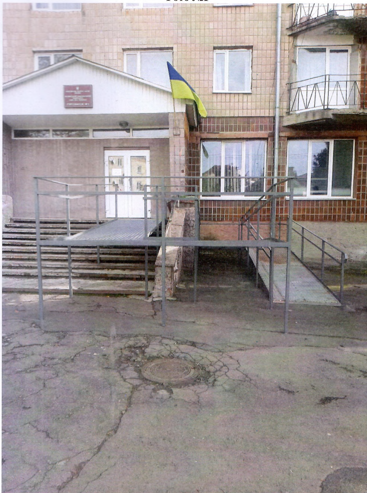
Загальний вигляд пандуса