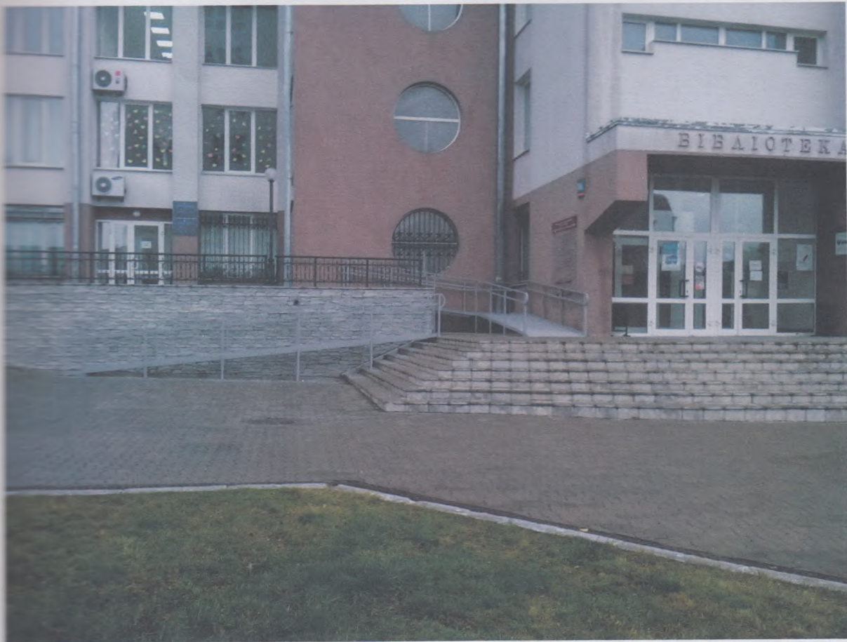
Загальний вид. Фото №2