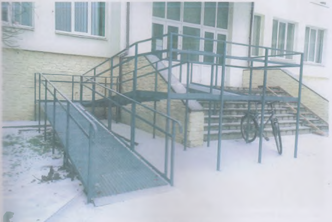
Зовнішній пандус при головному вході в аудиторно-лабораторний корпус №2