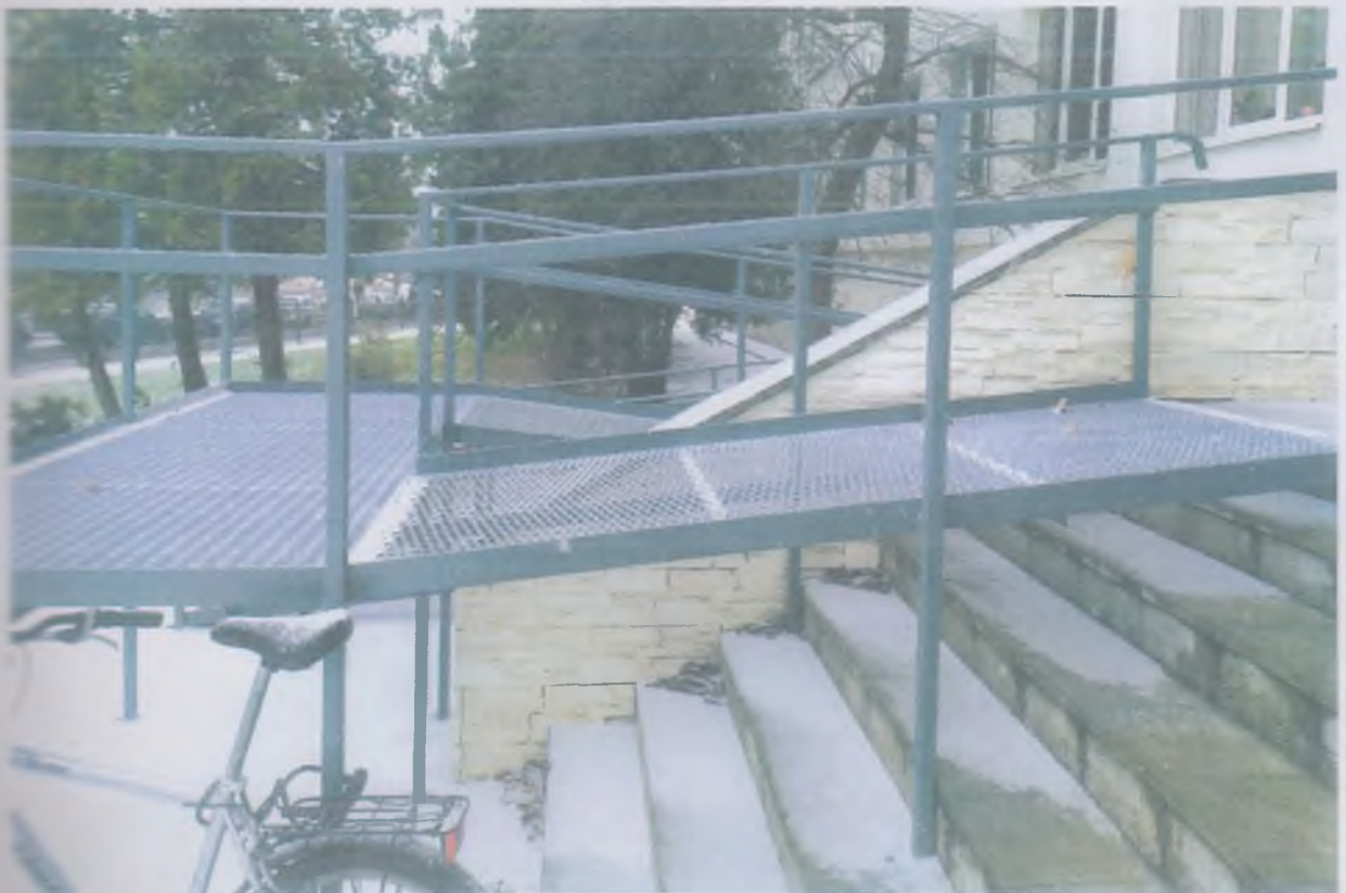
Зовнішній пандус при головному вході в аудиторно-лабораторний корпус №2