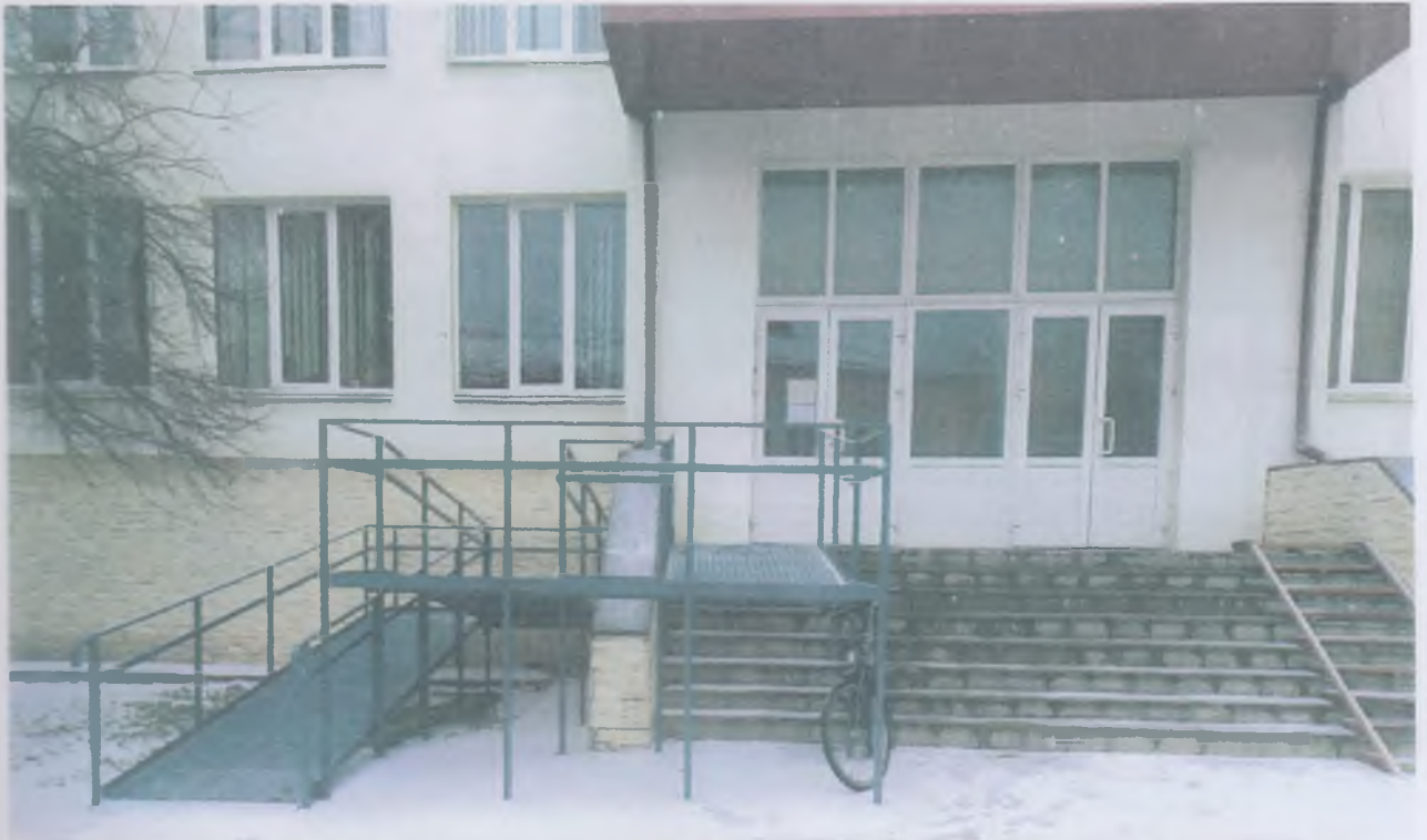
Фрагмент фасаду головного входу в аудиторно-лабораторний корпус №2