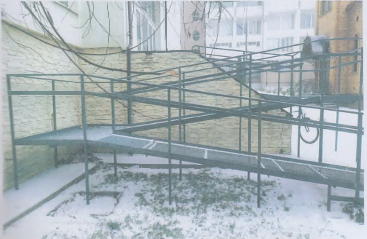
Зовнішній пандус при головному вході в аудиторно-лабораторний корпус №2