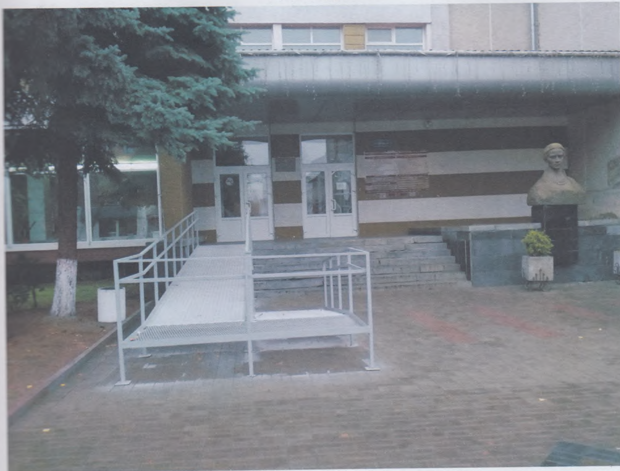
Загальний вид. Фото №2